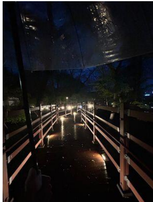
Illustration 2: Campus de CBNU