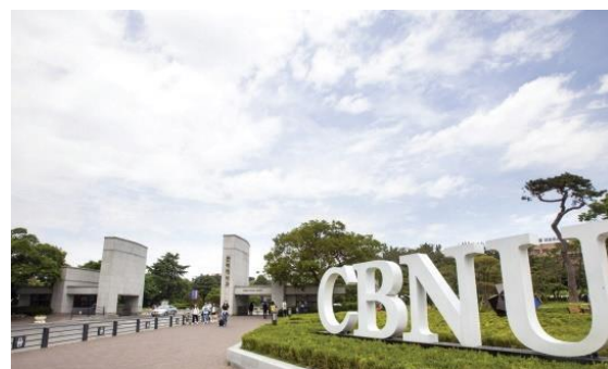
Figure 1: Localisation de l'université Nationale de Cheongju

Le laboratoire Smart Structures Lab (SSL) est l'un des nombreux laboratoires présents sur le campus de l'université. C'est au sein de ce laboratoire que j'ai eu la chance de réaliser mon stage de 2A s'inscrivant dans ma formation GCBD BE.